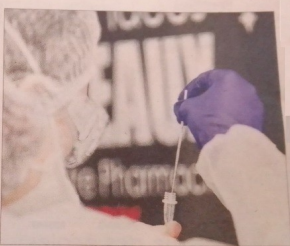
Une campagne de tests PCR aura lieu sur deux jours.

Les cas de Covid sont en forte augmentation sur le territoire de Bellegarde. Le taux de positivité (23,2 %) et le taux d'incidence (660/100 000 habitants) sont largement supérieurs à la moyenne départementale (10,1 % et 225/100 000 habitants). L'Agence régionale de santé ainsi que la préfecture de l'Ain organisent une campagne de dépistage d'ampleur sur deux jours pour détecter en plus grand nombre les cas positifs. Les autorités recherchent aussi une éventuelle trace des variants.