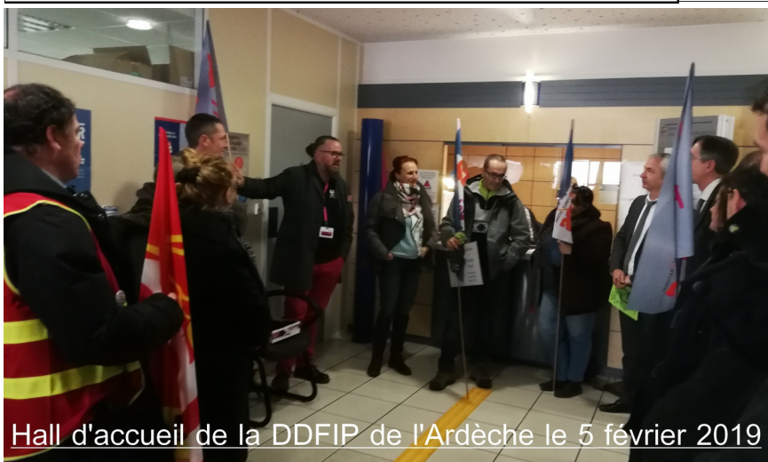
Hall d'accueil de la DDFIP de l'Ardèche le 5 février 2019

Messieurs GRANGERET et BLUTEAU ont tenté de nous rassurer, soutenant que les suppressions d'emplois en 07 dans le cadre du nouveau réseau n'étaient pas encore connues pendant que la préfète tenait apparemment un discours bien plus anxiogène. Nous avons porté les revendications de l'ensemble des agents de l'Ardèche et les copain.e.s présent.e.s ont pu témoigner de la colère et du désarroi que connaît l'ensemble des services. Merci pour leur active participation.