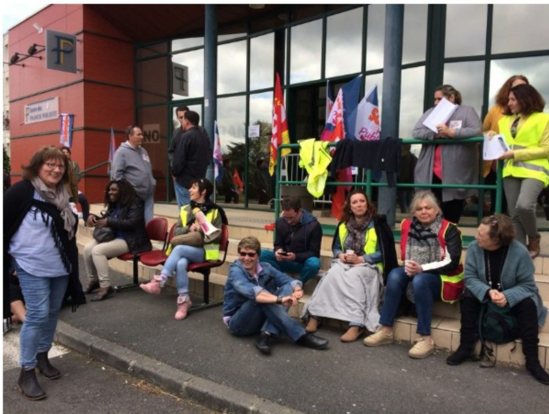
Les agents du centre des impôts de Caen (Calvados) sont en grève ce lundi 23 avril 2018.