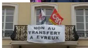
20/10/2017 Grève et tractage à Pont Audemer