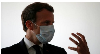
Emmanuel Macron, le 7 avril, à Pantin.

PAR FRANÇOIS BONNET ARTICLE PUBLIÉ LE DIMANCHE 12 AVRIL 2020