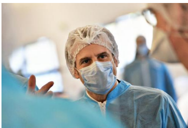
Emmanuel Macron en visite le 31 mars à la société de production de masques Kolmi-Hopen, à Saint-Barthélemy-d'Anjou, près d'Angers.

30 mars. Le seuil des 3 000 morts en milieu hospitalier est franchi.