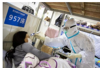
Contrôle à Wuhan.

7 janvier 2020. Le virus est séquencé, sa carte d'identité est établie. Il s'agit d'un coronavirus. Baptisé 2019-nCoV puis SARS-CoV-2, le coronavirus provoque la maladie Covid-19.