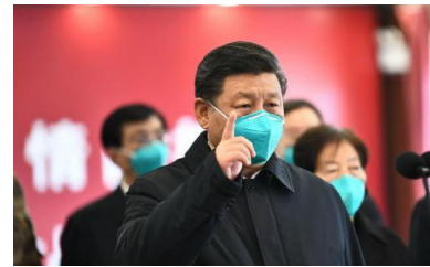
Xi Jinping à Wuhan. Il ne se rendra dans la Ville que le 10 mars.

La ministre de la santé Agnès Buzyn : « Le risque d'importation depuis Wuhan était modéré. Il est maintenant pratiquement nul, puisque la ville, vous le savez, est isolée. Les risques de propagation dans la population [française] sont très faibles. »