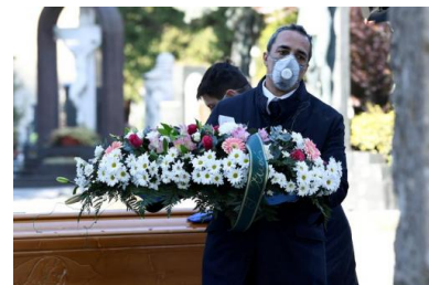
Dans un cimetière de Bergame le 16 mars 2020.

7 mars. Plus de 100 000 cas de Covid-19 sont enregistrés dans le monde, selon l'OMS.