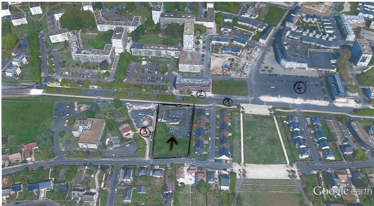
(1) Avenue de l'Europe - (2) Maison des Syndicats - (3) Mosquée de Blois - (4) Place Bernard Lorjou