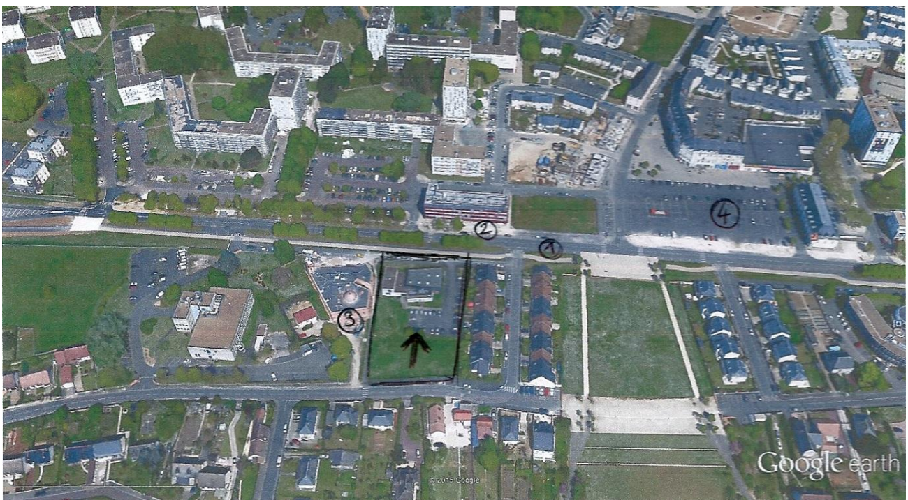
(1) Avenue de l'Europe - (2) Maison des Syndicats - (3) Mosquée de Blois - (4) Place Bernard Lorjou