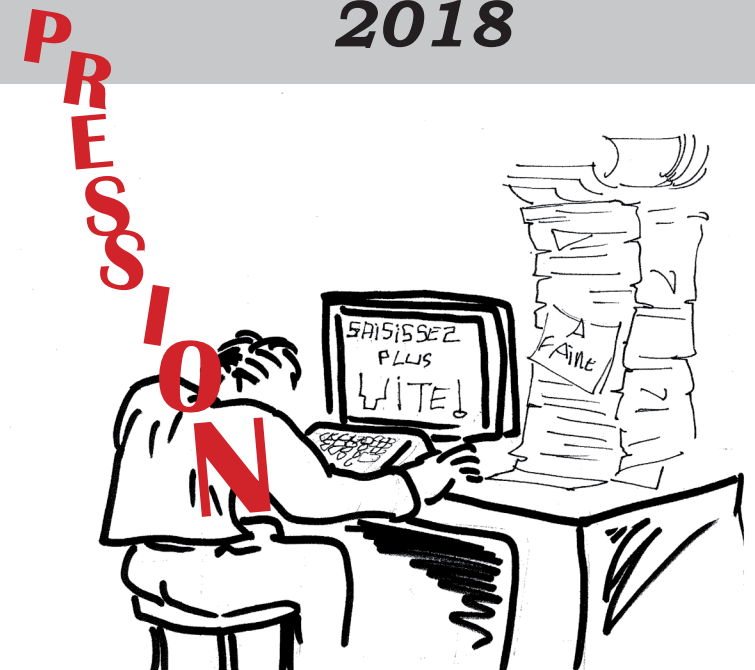
Le rendement remis au «go t» du jour   la DGF IP

Objectifs de saisie chiffr es et individualis es, travail de masse, ordre et contre-ordre, travail dans l'urgence, multiplication des applicatifs, notes de services   rallonge, travail sur liste, contr ole interne, r eorganisations permanentes, manque d'autonomie, etc.