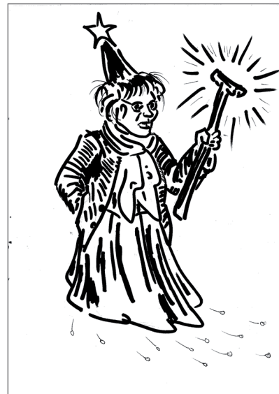
Le «charme» de la f ee DGF IP