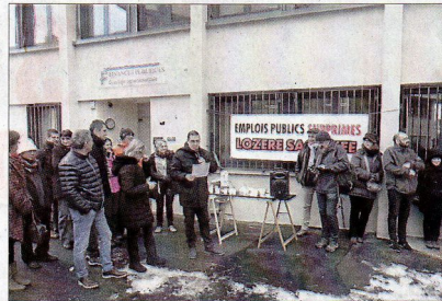
■ Un rassemblement devant la direction départementale.

84 grévistes pour 135 agents, 12 structures fermées dans le département, et 50 agents présents à la manifestation, mardi 19 décembre à Mende. Tel est le bilan chiffré de l'action de protestation organisée par une intersyndicale (Solidaires, CGT et FO) des fonctionnaires Finances publiques. À l'heure d'un comité technique local consacré aux neuf nouvelles suppressions de postes effectives au 1 er septembre 2018, les manifestants ont voulu protester contre la détérioration de leurs conditions de travail : « 45 suppressions d'emploi de 2011 à 2018; mise à mal du maillage territorial; détérioration de la qualité du service public; mal-être illustré par les enquêtes du baromètre social; refus du directeur de prendre en compte ces difficultés », ont expliqué les