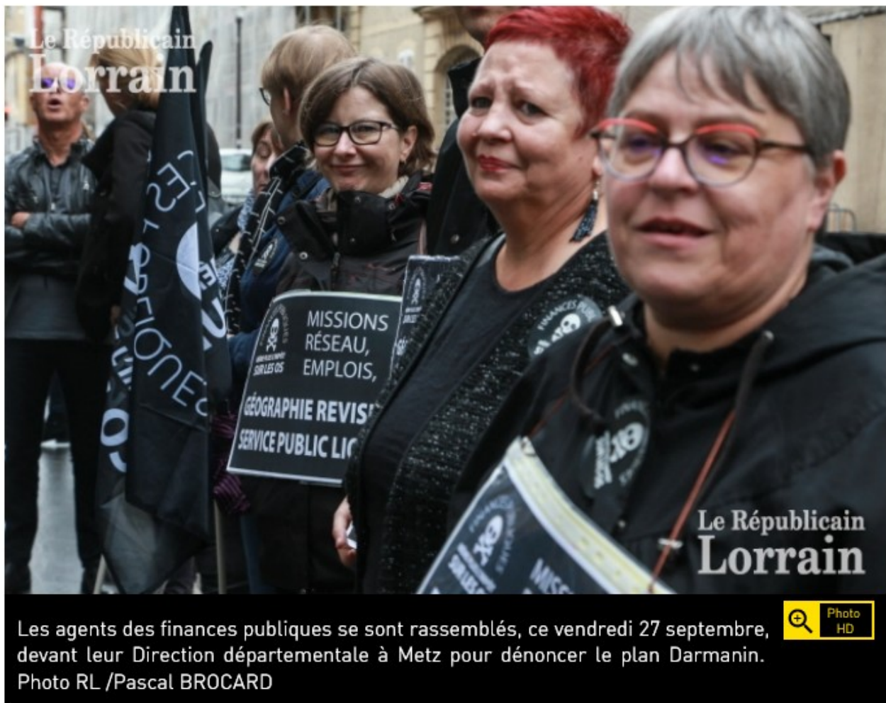
Les agents des finances publiques se sont rassemblés, ce vendredi 27 septembre, devant leur Direction départementale à Metz pour dénoncer le plan Darmanin.