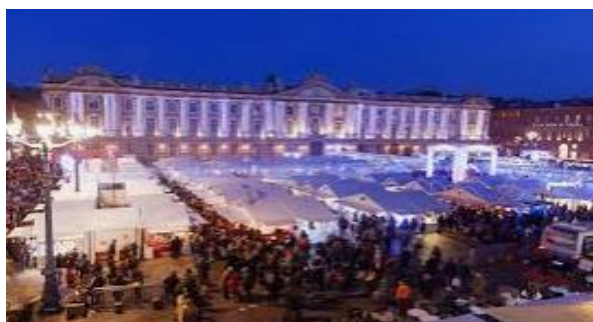
Marché de Noël de Toulouse