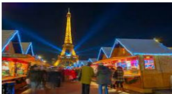
Marché de Noël de Paris

Et maintenant, quelques marchés ... en images !