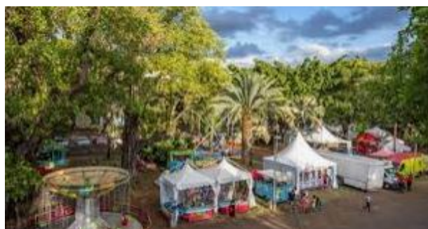
Marché de Noël de St Denis de la Réunion