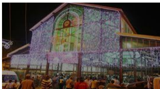
Marché de Noël de Fort-de-France