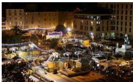
Marché de Noël d'Ajaccio