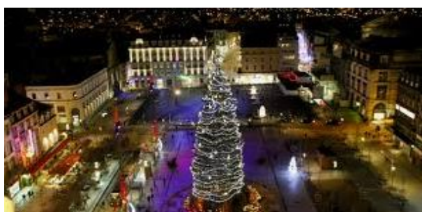
Marché de Noël de Clermont-Ferrand