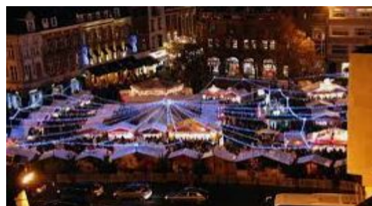
Marché de Noël de Lille