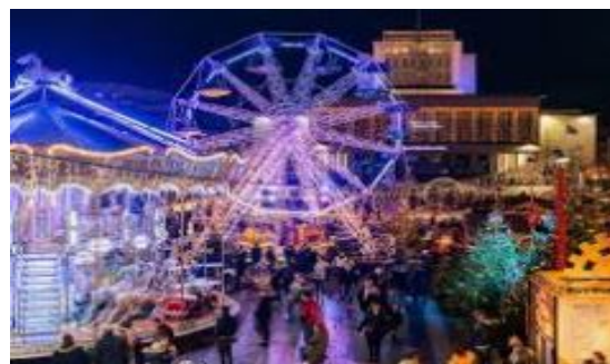
Marché de Noël de Brest